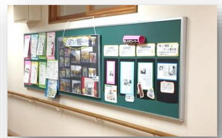
管理棟1階:新聞掲載紹介等