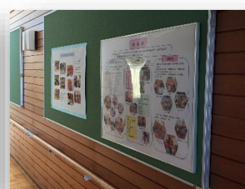
早期教育棟:幼稚部の取組