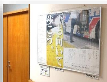
管理棟1階:キャンペーンポスター