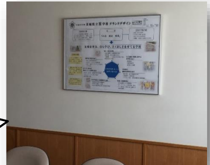
応接室:学校グランドデザイン