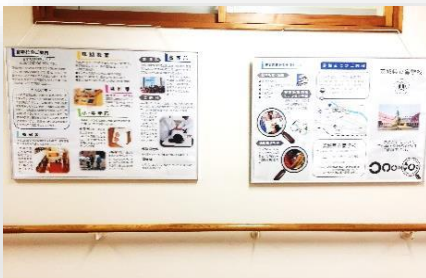
管理棟1階:学校の取組