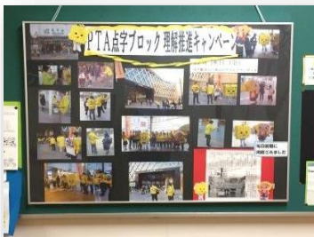
管理棟1階:キャンペーン活動