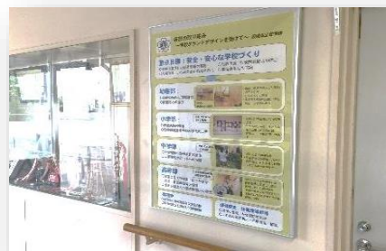
管理棟1階:各部の重点目標