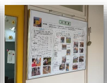
1号館1階:小学部の取組