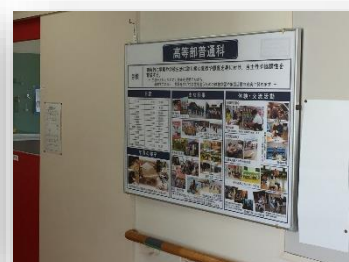
1号館2階:高等部の取組