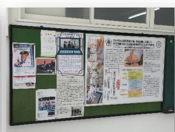
2号館1階:理療科の取組