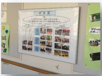
1号館2階:中学部の取組