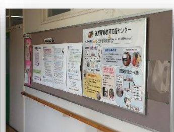
管理棟2階:センターの取組