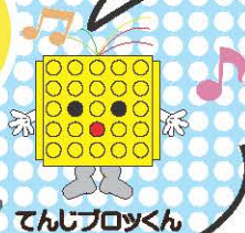
てんじブロックん